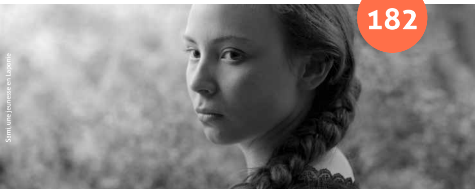
Sami, une Jeunesse en Laponie