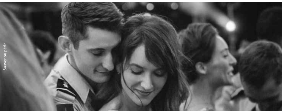
Sauver ou périr